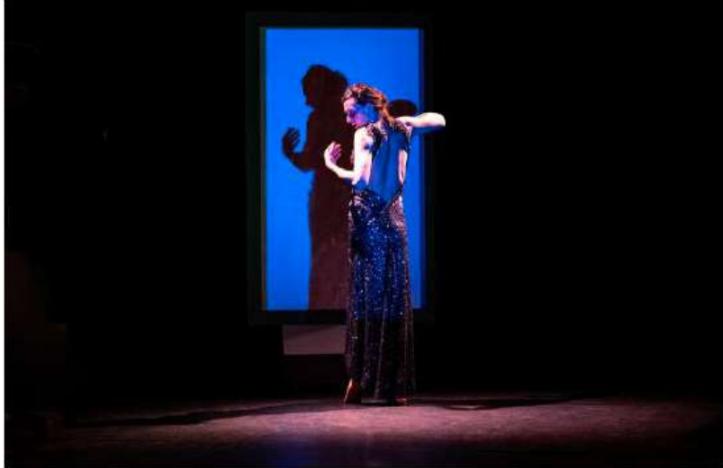
"En finir avec Eddy Bellegueule" à l'Atelier 210.