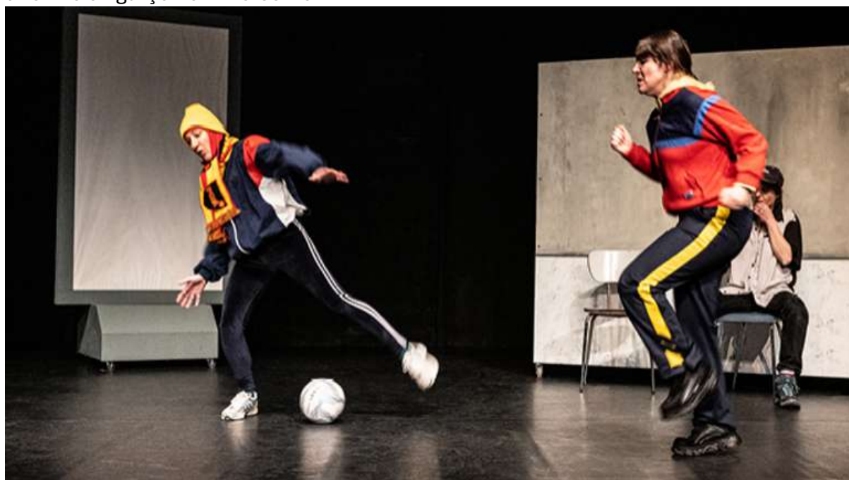
"En finir avec Eddy Bellegueule", au Jean Vilar